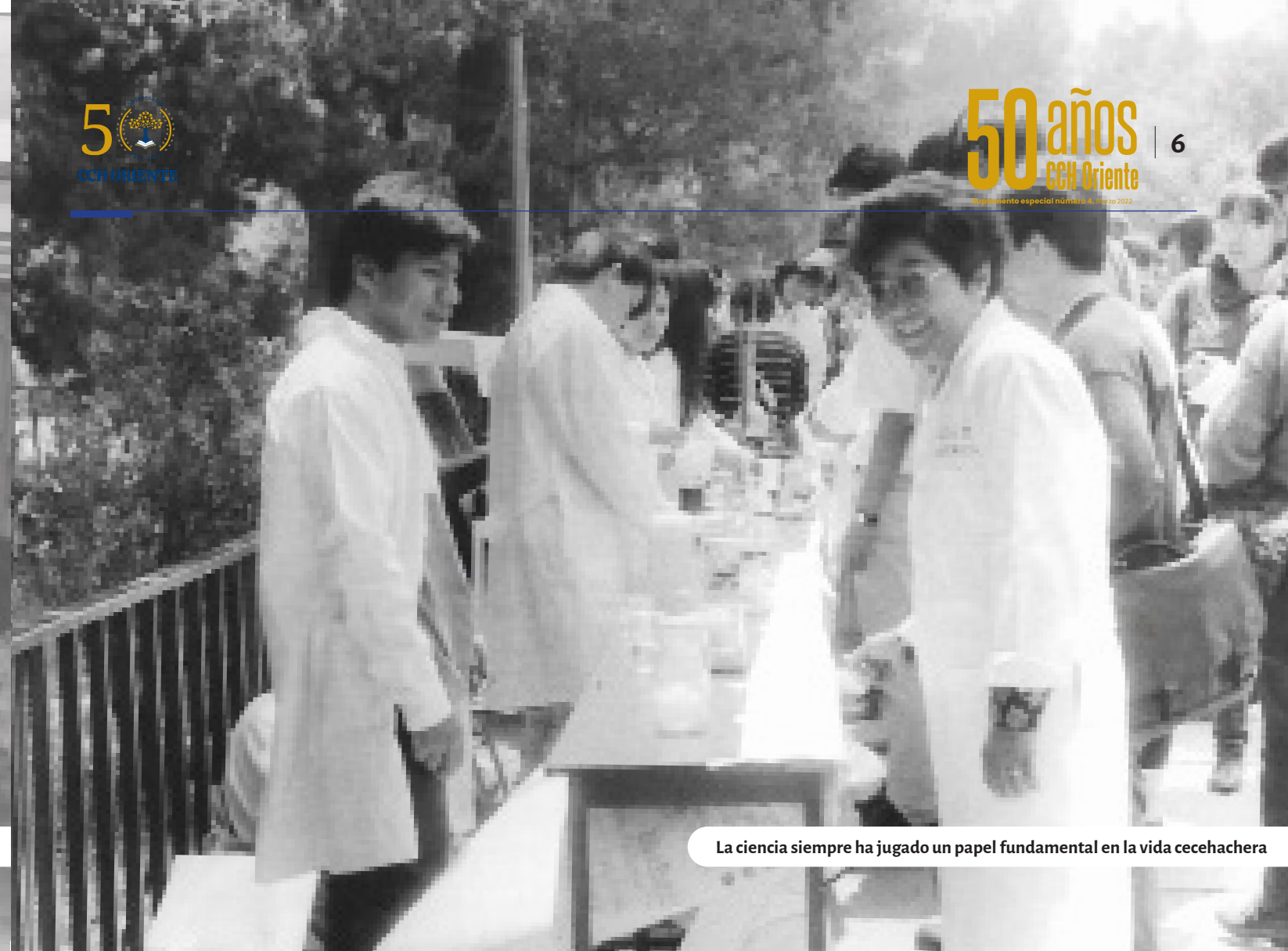
La ciencia siempre ha jugado un papel fundamental en la vida cecehachera

Apoyo a Materias Difíciles (PAMAD), el cual constaba de cursos intensivos en los que se hacía hincapié en el área de matemáticas, ciencias experimentales, histórico-social, y talleres de lenguaje y comunicación. De la misma manera, se buscaba que el deporte fuera determinante en el proceso de enseñanza-aprendizaje.