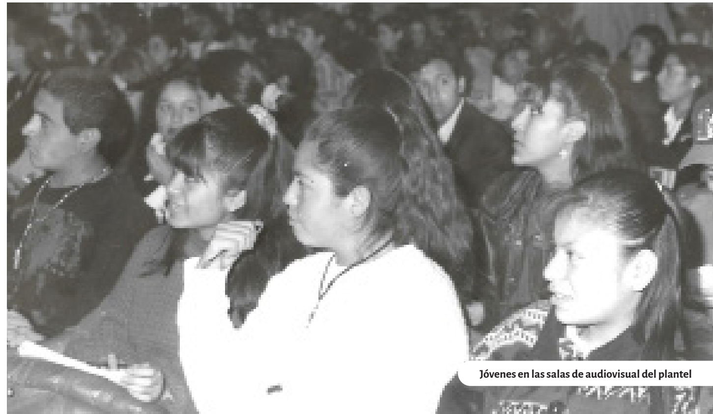
Jóvenes en las salas de audiovisual del plantel

En los pasillos del plantel se leía “La Jornada”, el periódico de cabecera en nuestra escuela, en tanto se escuchaba la música grunge con Nirvana como máximo representante (lo que puso de moda