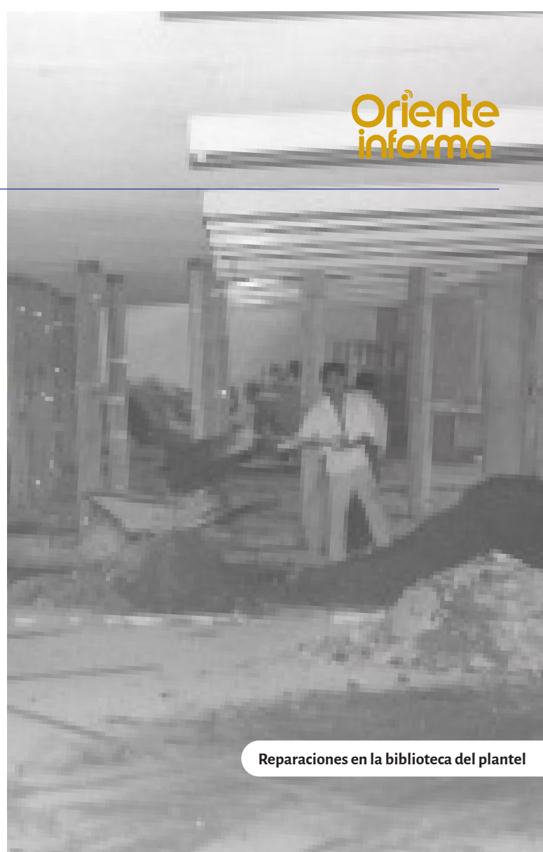
Reparaciones en la biblioteca del plantel