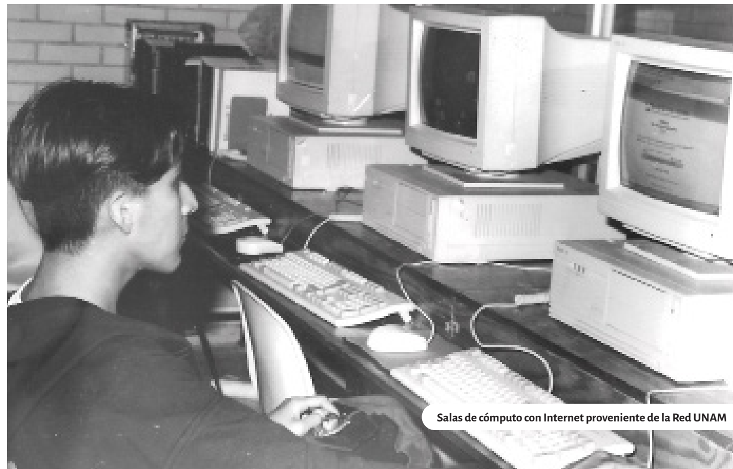
Salas de cómputo con Internet proveniente de la Red UNAM

No podía ser diferente, este centro educativo en las múltiples manifestaciones, la participación del alumnado y el profesorado fueron notables, pues en las congregaciones llevaban el mayor número de personas del contingente y el CCH Oriente se hacía presente una vez más en esa historia universitaria y cecehacera que