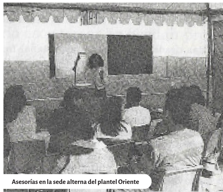
Asesorías en la sede alterna del plantel Oriente

Sin duda, el momento más complejo, se vivió a partir de la publicación y aprobación de la reforma del Reglamento General de Pagos que provocaría una huelga que iniciaría en abril de 1999 y culminaría varios meses después. Si bien el plantel Oriente intentó proseguir con sus actividades académicas administrativas en sedes alternas, este paro condicionó la forma en que la Universidad y nuestro centro educativo encaró la entrada de la siguiente década y del nuevo siglo. —