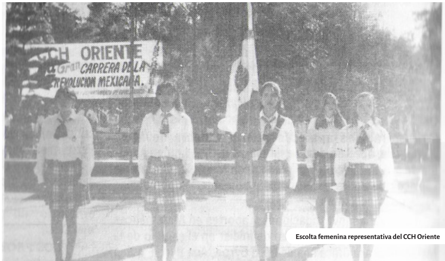
Escolta femenina representativa del CCH Oriente

los pantalones de mezclilla rotos y las camisas de franela). Además del rock alternativo, con bandas como Radiohead, el pop arrasaba con figuras como Britney Spears o los Backstreet Boys, y en español con cantantes como Fey y la escandalosa Gloria Trevi. Pero sería la banda de ska, Panteón Rococó (surgidos de la Prepa 9), quienes compondrían un “himno cecechero”, la movida “La dosis perfecta”, que animaría frenéticos slams en la explanada del plantel.