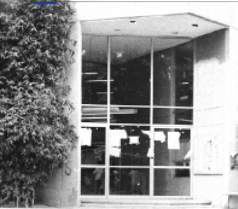
La biblioteca "Guillermo Haro" en la década de los 90