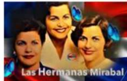
Las Hermanas Mirabal

Como cada año desde 1999, el 25 de noviembre se conmemora el 25N: Día Internacional de la Eliminación de la Violencia Contra la Mujer. Esta fecha fue elegida por la Organización de las Naciones Unidas para honrar la vida y el activismo de las hermanas Mirabal, quienes fueron brutal-